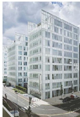
Takao Shimamura / Jean-Paul Viguier et associés

▲ Les bureaux sont installés dans un immeuble fraîchement certifié «HQE exceptionnel» et «BREEAM Fit-out Outstanding».