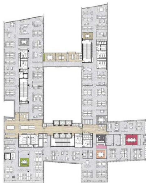
PLAN D'AMÉNAGEMENT DU R+4

▲ Les bureaux sont installés dans un immeuble fraîchement certifié «HQE exceptionnel» et «BREEAM Fit-out Outstanding».